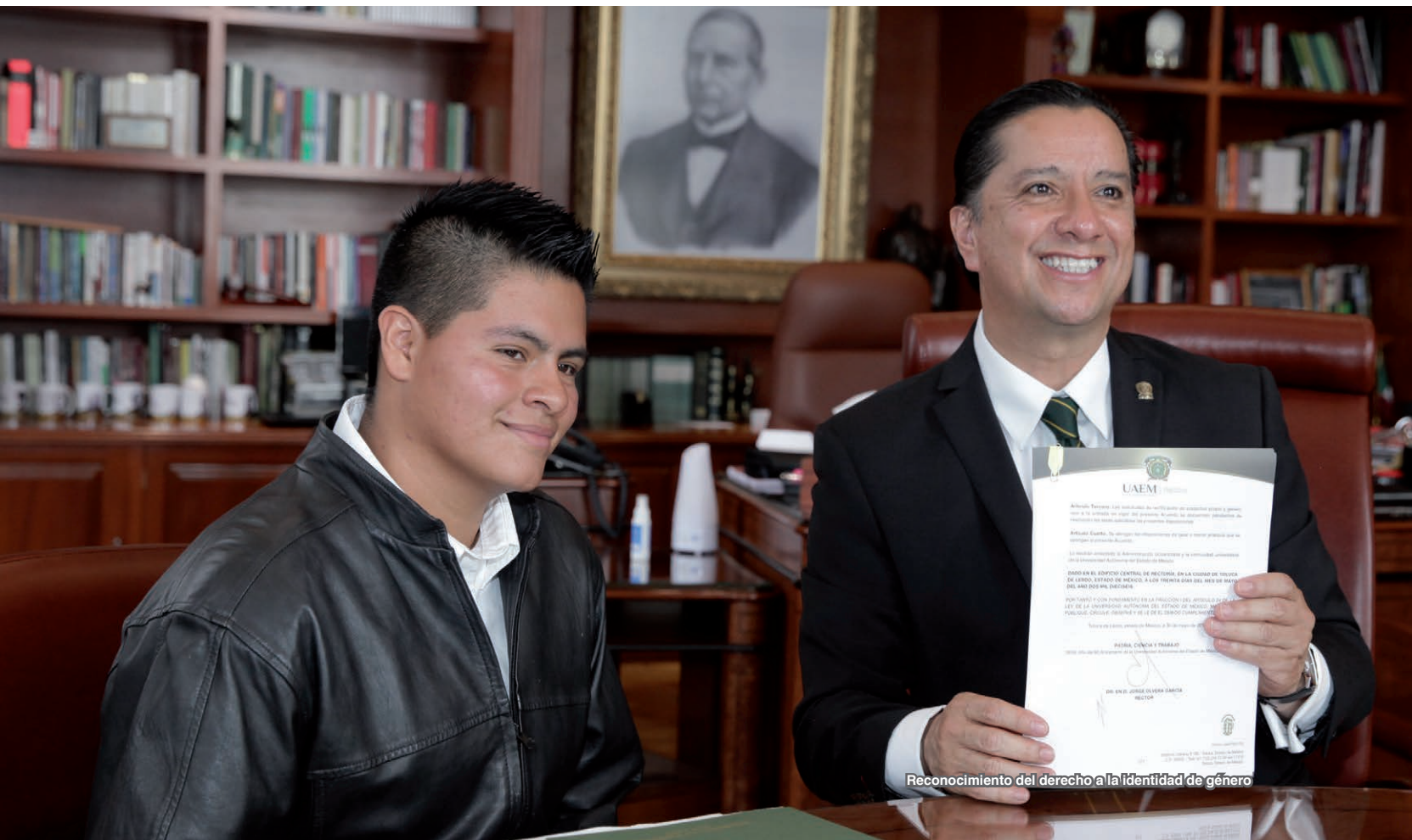
Reconocimiento del derecho a la identidad de género

La generación de conocimiento y su efectiva transmisión a la sociedad constituyen una actividad diaria de las instituciones educativas, con la finalidad de que ésta se realice en observancia del marco jurídico, se efectuaron 58 registros de obra, 8 reservas de derecho al uso exclusivo, 15 renovaciones de derecho al uso exclusivo, 99 trámites de número internacional normalizado del libro (ISBN) y 8 de identificación a un título o a una edición (ISSN).