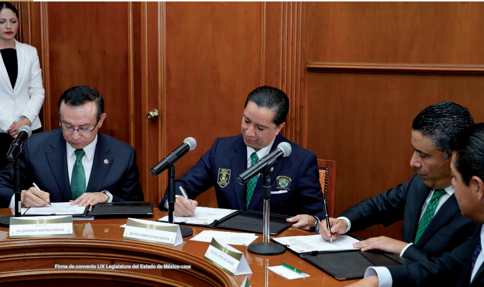
Firma de convenio LIX Legislatura del Estado de México-UAEM