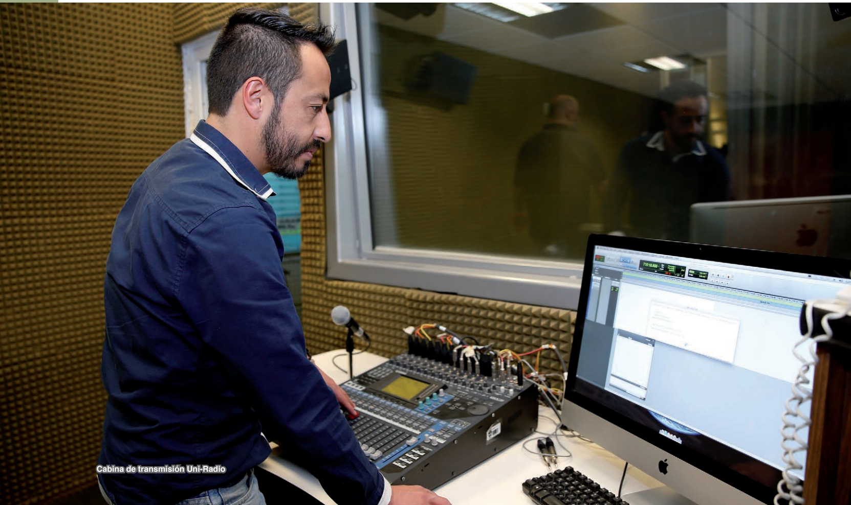
Cabina de transmisión Uni-Radio