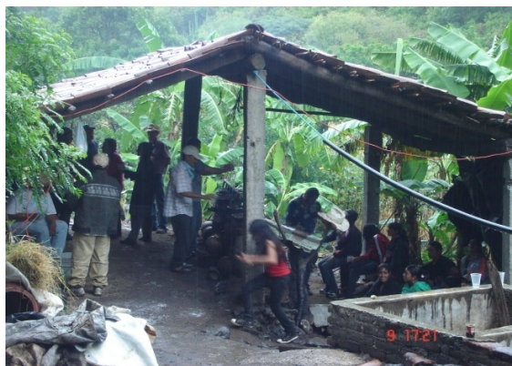
Figura 15. En compañía de la familia y amigos.