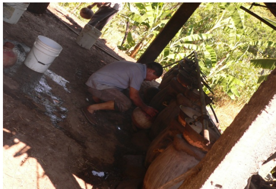
Figura 13. Preparando la recolecta de mezcal.