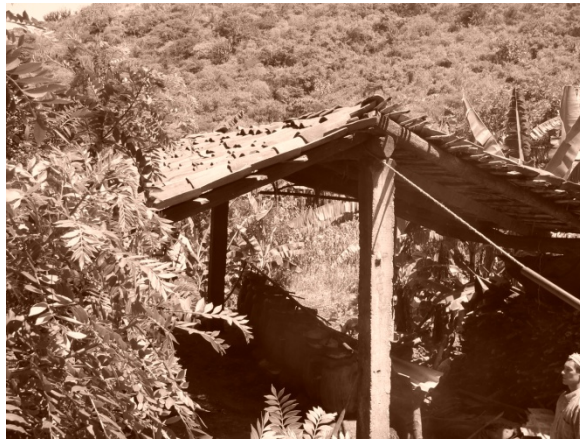
Figura 8. Cocina de la vinata de don Mino.