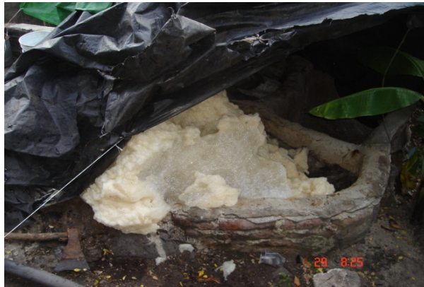
Figura 7. Respiración de la levadura en la fermentación.