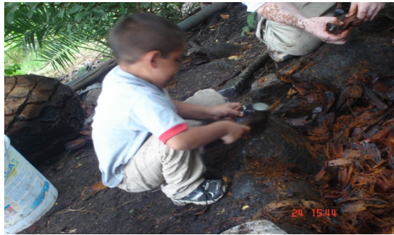
Figura 6. Ayuda del integrante más pequeño de la familia.