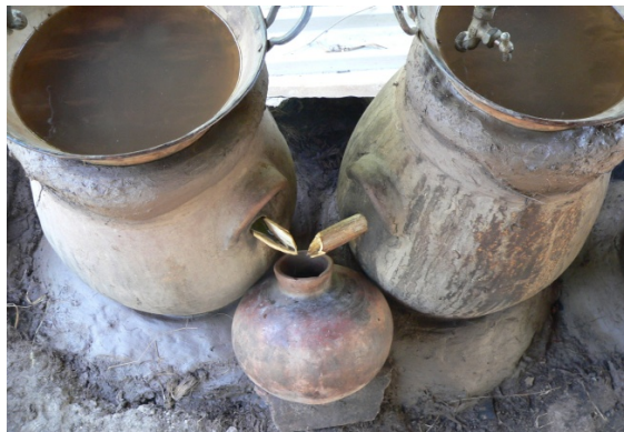
Figura 11. Destiladores de barro.