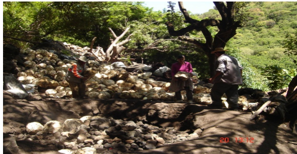
Figura 4. Acomodando piñas en el horno.