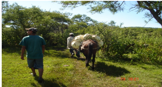
Figura 3. Carga de piñas de maguey.