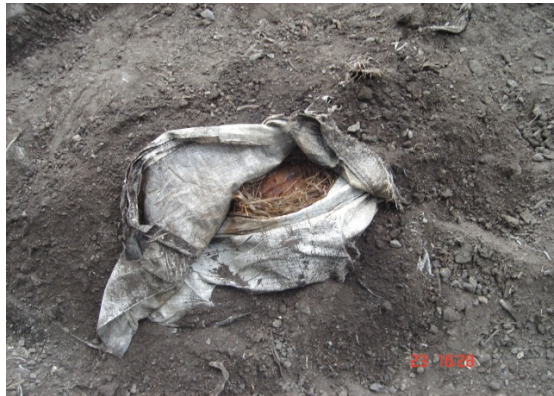
Figura 5. Revisión de la cocción de las piñas.