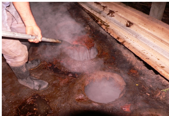
Figura 10. Descarga de las ollas destiladoras.