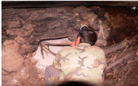
Figura 12. Revisión del fuego.