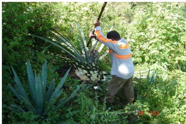
Figura 2. Jima del maguey “Manso”.