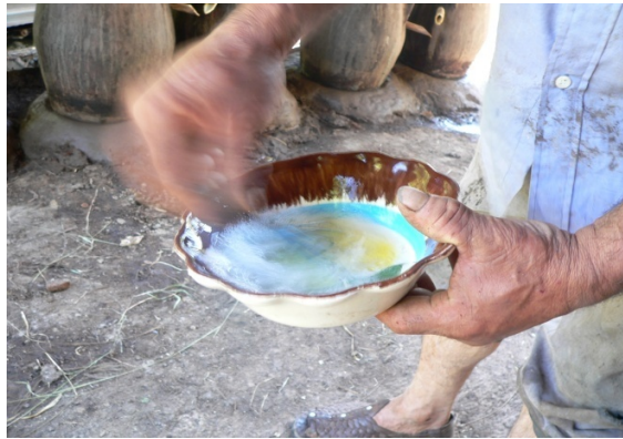
Figura 14. Prueba de calidad (Batido de mezcal).