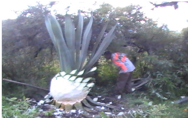
Figura 1. Jima de maguey “bruto”.