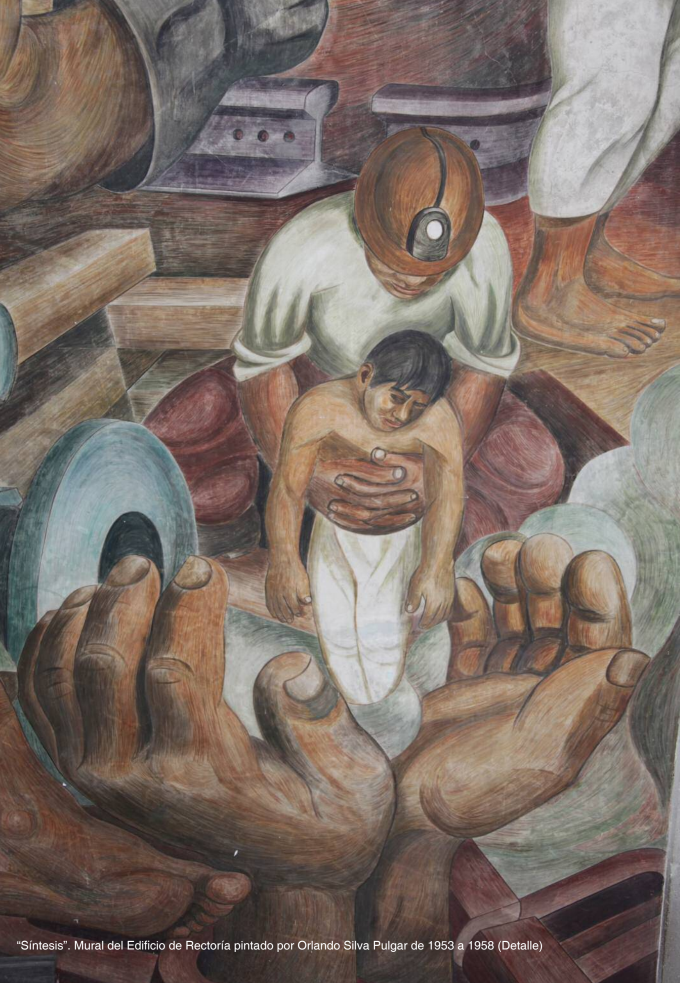
"Síntesis". Mural del Edificio de Rectoría pintado por Orlando Silva Pulgar de 1953 a 1958 (Detalle)