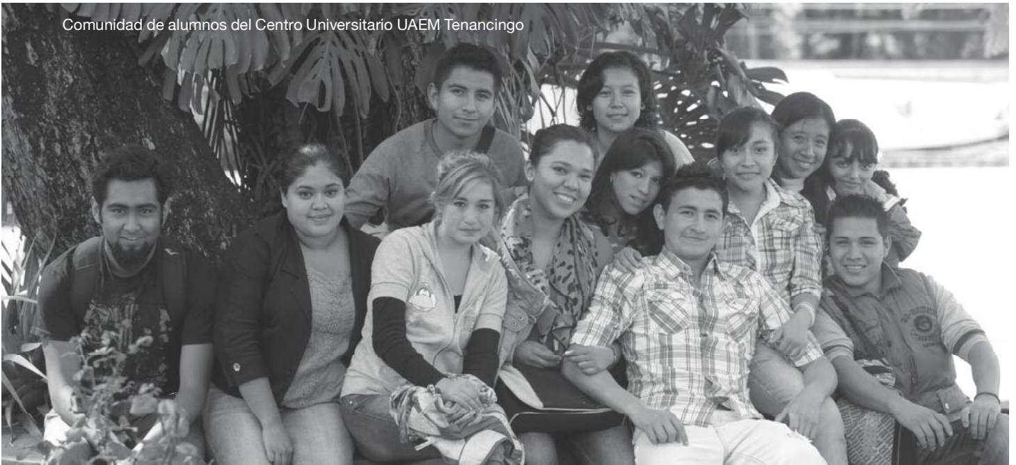
Comunidad de alumnos del Centro Universitario UAEM Tenancingo