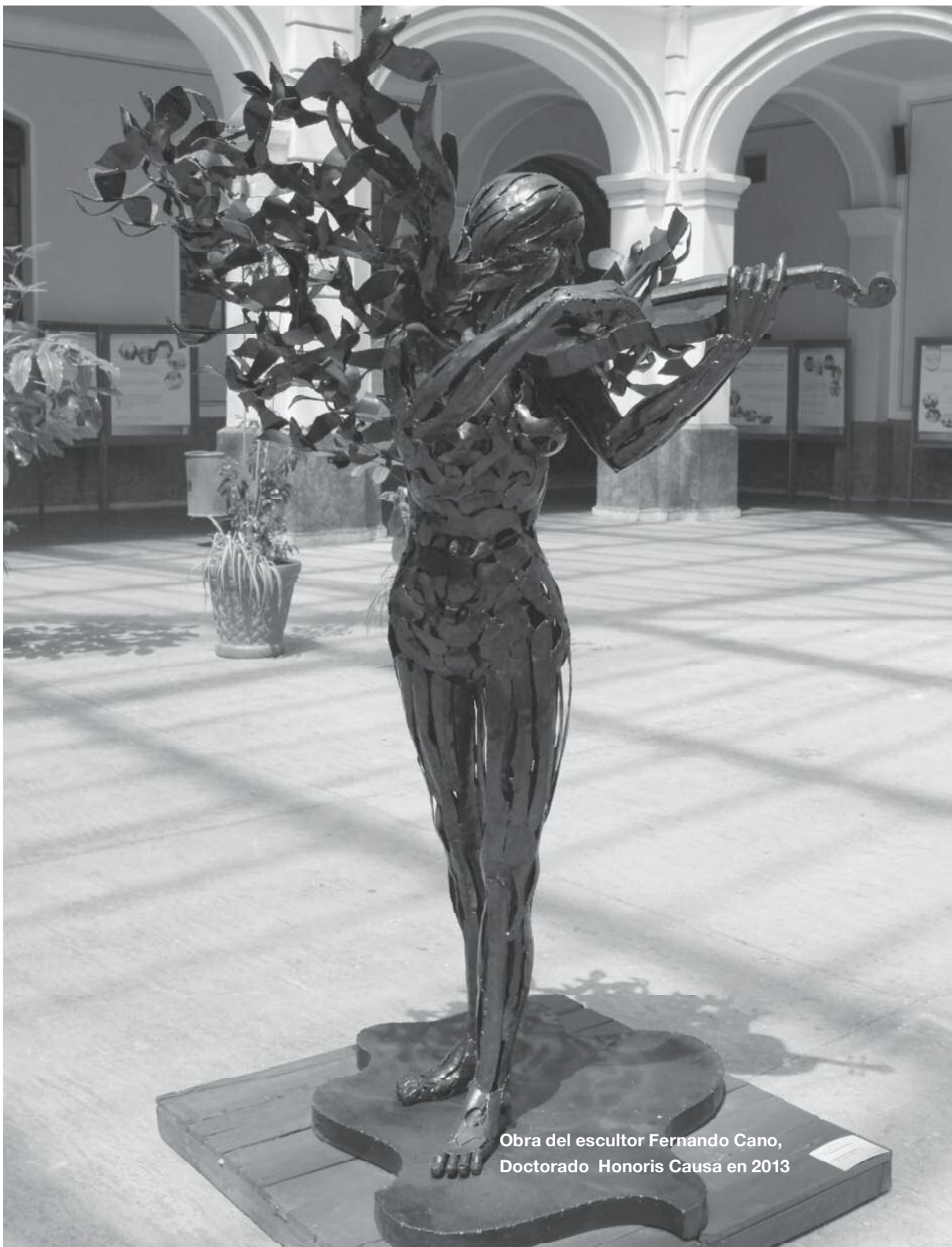
Obra del escultor Fernando Cano, Doctorado Honoris Causa en 2013

diversas disposiciones del Reglamento del Reconocimiento al Mérito Universitario de la Universidad Autónoma del Estado de México, en los términos de los documentos anexos.