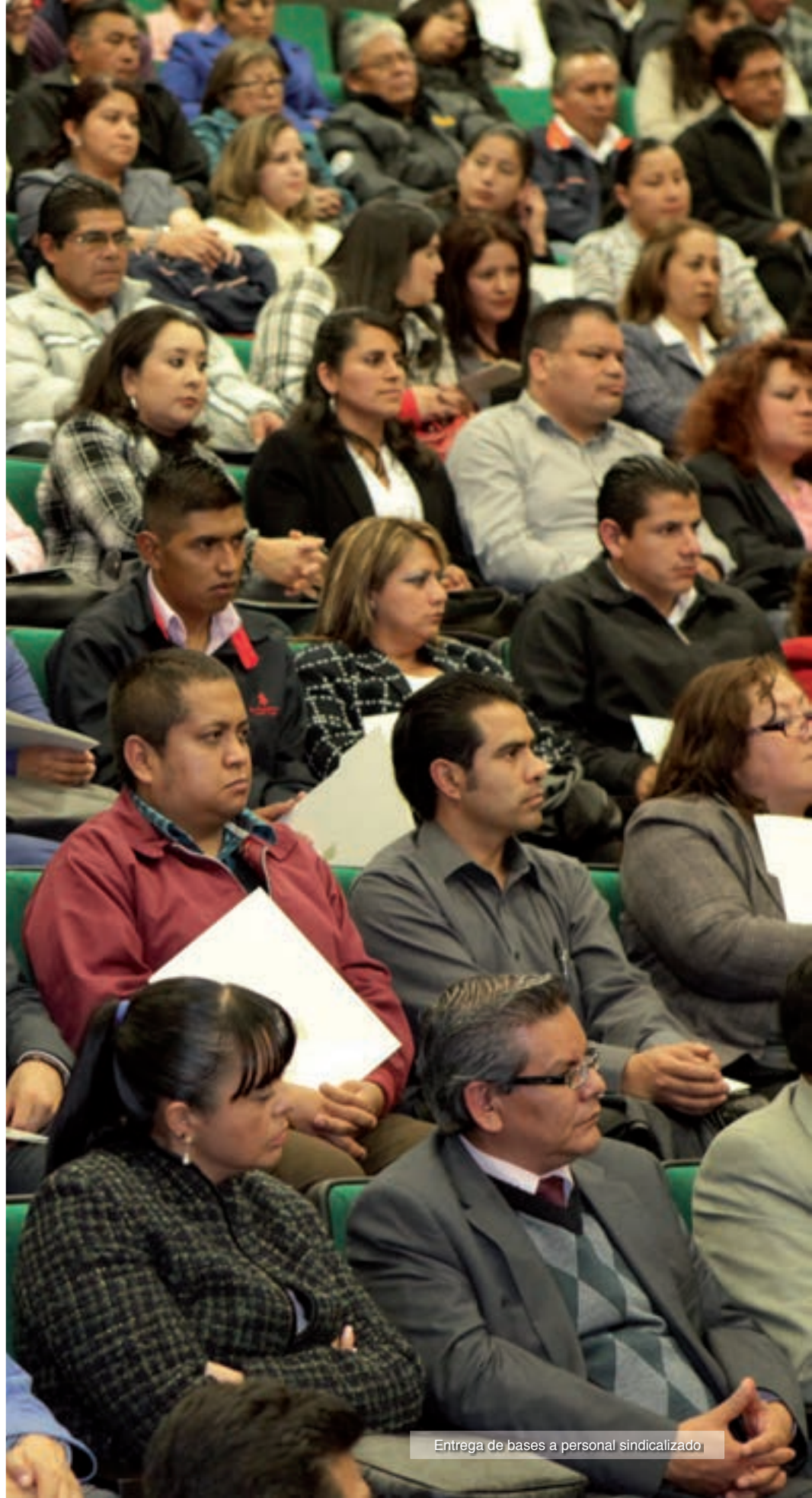
Entrega de bases a personal sindicalizado