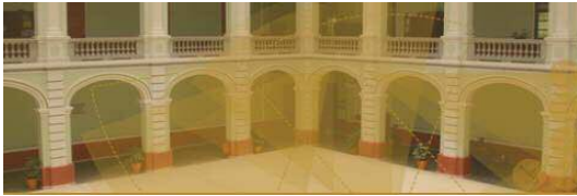
Planteo "Ignacio Ramírez Calzada" de la Escuela Preparatoria