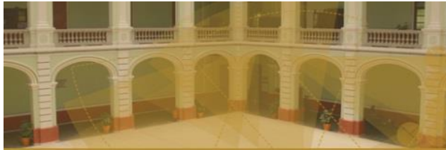
Plantel "Ignacio Ramírez Calzada" de la Escuela Preparatoria